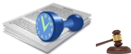
Tavola sinottica dei termini del ricorso giurisdizionale

Indirizzo: Commissione per l'accesso ai documenti amministrativi c/o Presidenza del Consiglio dei Ministri Dipartimento per il Coordinamento Amministrativo - Via della Mercede, 9 - 00187 Roma Telefono: 06.6779.6700 Fax: 06.6779.6684 commissione.accesso@mailbox.governo.it